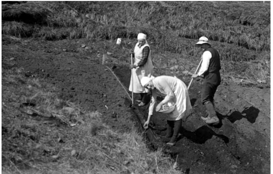
Verkafólk setur niður kartöflur um miðja síðustu öld.

Frá öndverðu var mikill áhugi á því innan verkalyðshreyfingarinnar að hreyfingin stuðlaði að sem mestri sjálfshjálpi verkafólks: að það tæki málin í eigin hendur með því að stórauka garðrækt og annað það sem að gagni mætti koma í lífsbaráttunni. 1 Fyrsta stig þessarar sjálfshjálpar var að stuðla að því að verkafólk gæti sjálft framleitt og útvegað sér mikilvægar lífsnauðsynjar. Liður í því gat verið að leigja land þar sem mátti stinga mó til eldsneytis. Sum verkalyðsfélög keyptu eða leigðu land til túnræktunar og garðræktar á öðrum, þriðja og fjórða áratugnum. Það gerði til dæmis Verkamannafélagið Dagsbrún í Reykjavík árið 1913 þegar félagið fékk land í erfðafestu til ræktunar á Melunum í Reykjavík. Áhugi félagsmanna Dagsbrúnar á þessu framtaki reyndist þó ekki brennandi og lét félagið Félagsteiginn, eins og