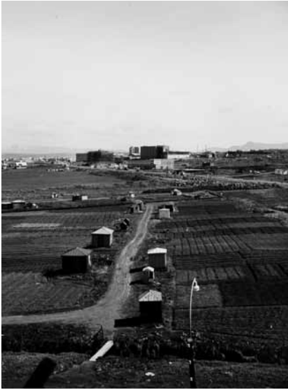
Horft austur Suðurlandsbraut.